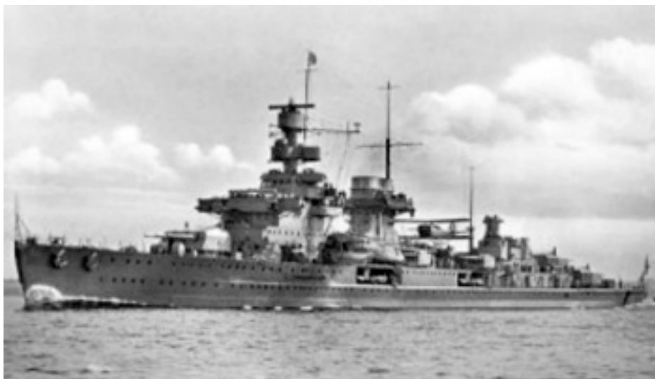
Den Sovjetiska kryssaren Admiral Makarov.