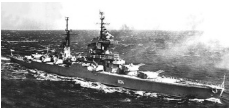
Sverdlov kryssare, Alexander Suvorov, byggd i Leningrad, operativ 15 maj 1952, skrotad 1990.

Ganska kryptiskt, eller hur? Men skickligt. Av normal omfattning för årstiden. Suck, det beror helt på vad man definierar som normalt. Ingen skulle med denna skrivning normal omfattning för årstiden komma på tanken att det skulle ha varit den största sovjetiska övningen, åtminstone under 1952, med runt hundra fartygsenheter i området där DC-3:an blev nedskjuten. I området fanns dessutom minst två stora kryssare, Admiral Makarov och den nya Sverdlov kryssaren. Dessutom ett tiotal ubåtar. 8