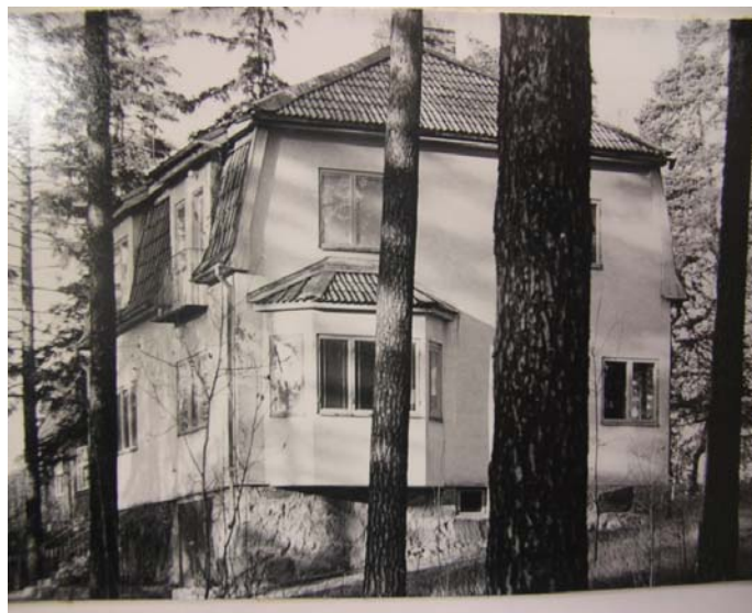
Boo Drammers villa på Riddarvägen Lidingö

ryssarna skulle utnyttja detta. Han stötte även rejält på bekantskapskretsens fruar. 12